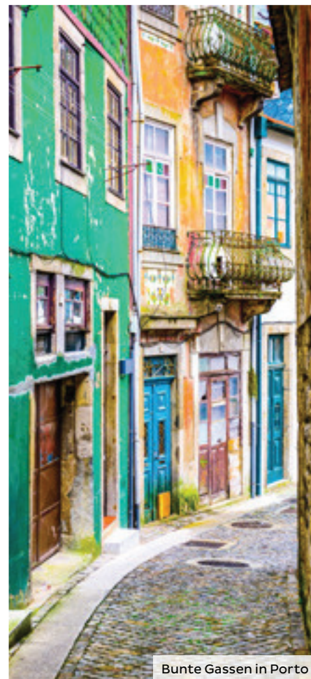
Bunte Gassen in Porto