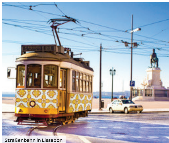
Straßenbahn in Lissabon