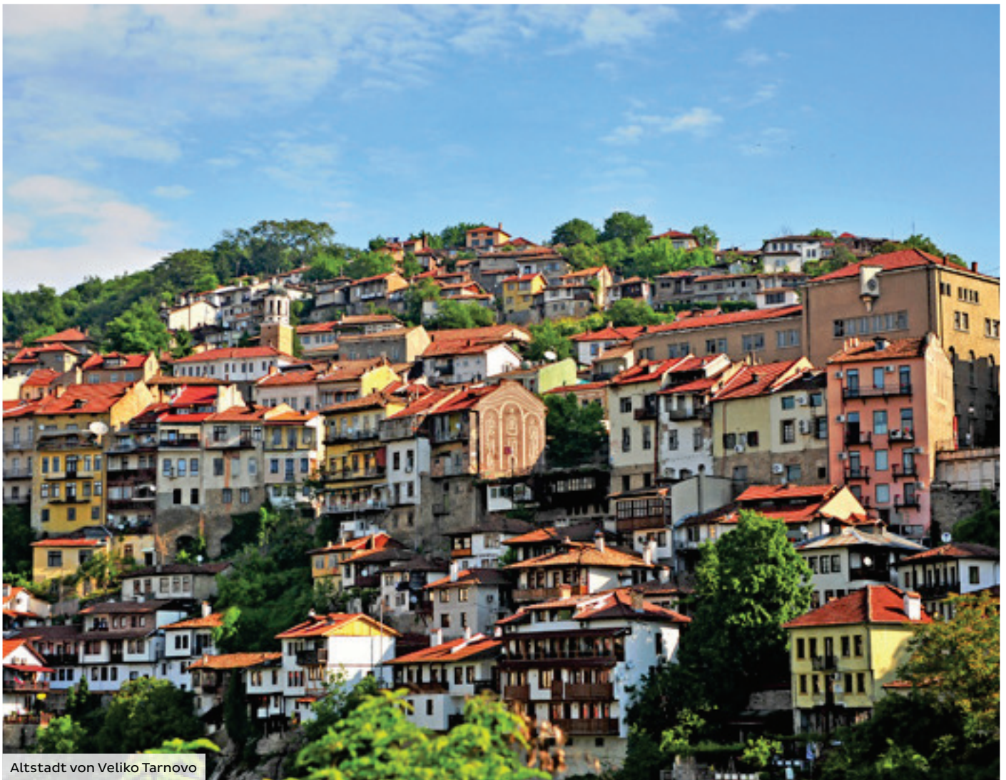
Altstadt von Veliko Tarnovo