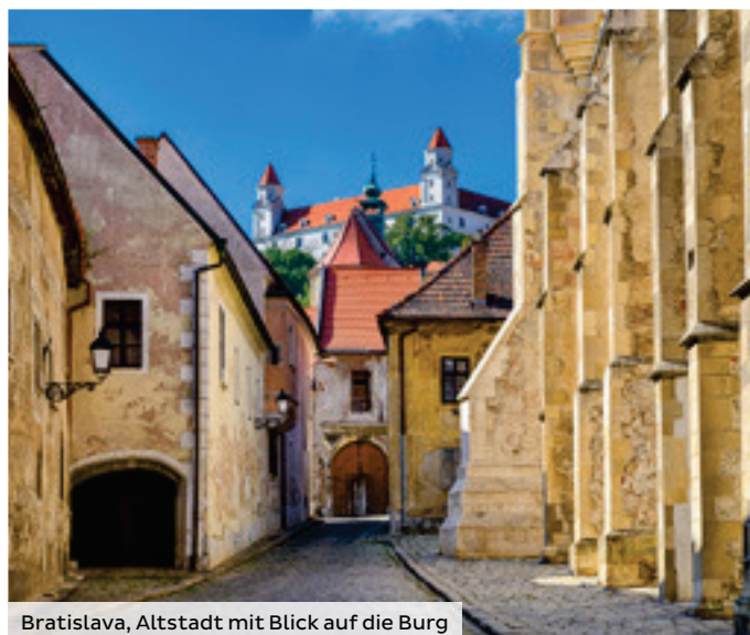
Bratislava, Altstadt mit Blick auf die Burg