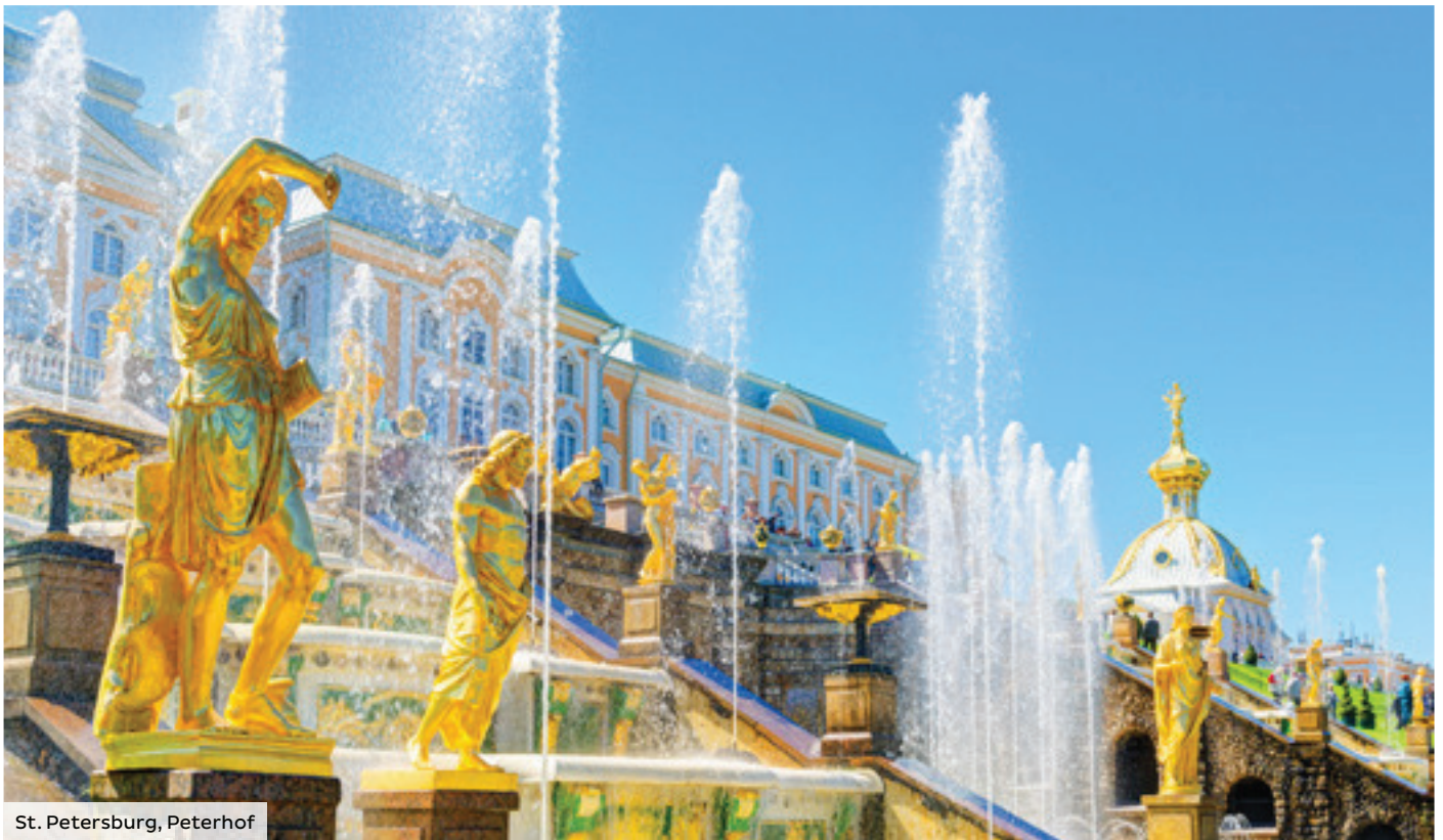
St. Petersburg, Peterhof