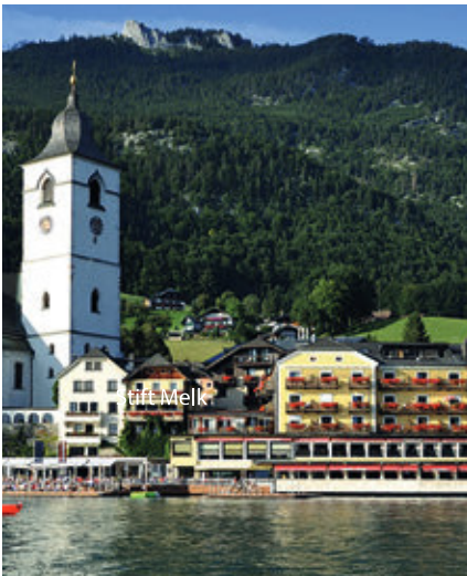
© Romantik Hotel 'Im Weißen Rössl'